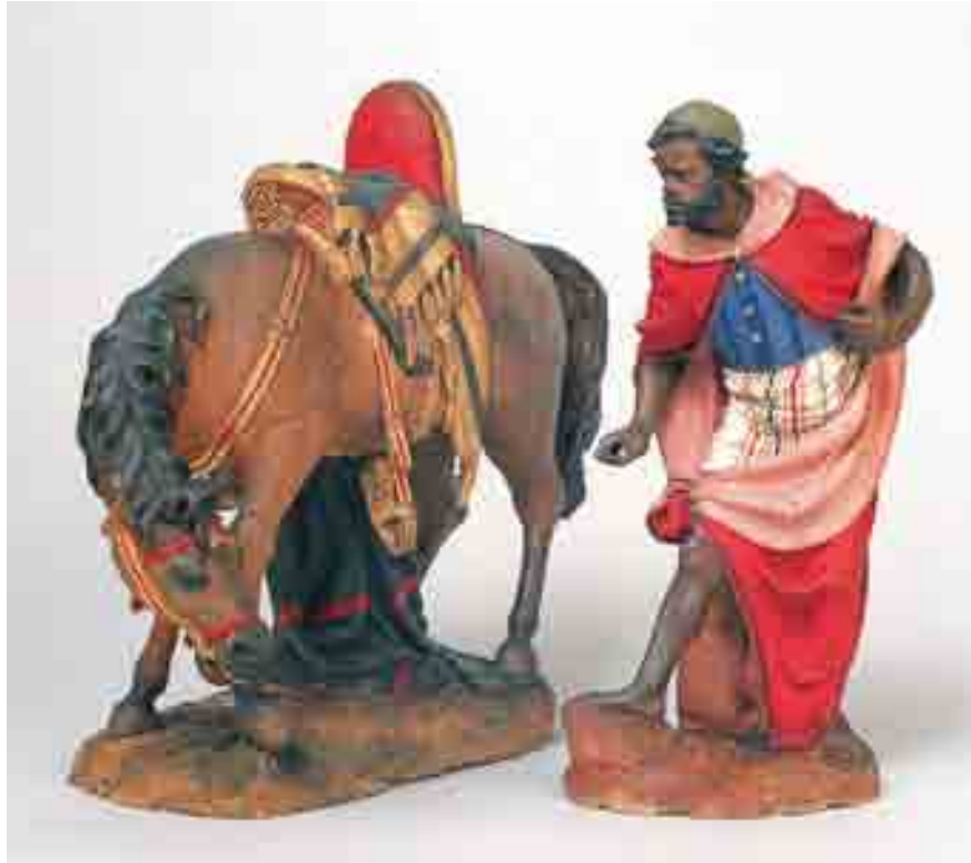
Servent 23.5 x 10.5 x 9