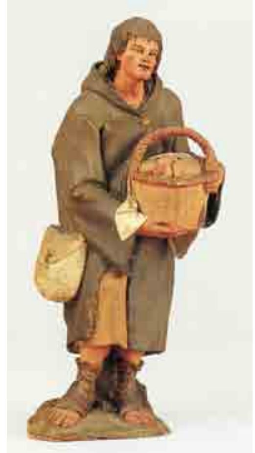
Pagès 22 x 10 x 7 Museu Etnològic de Barcelona