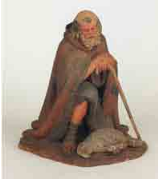
Pastor vell 16 x 16 x 13.5 Museu Etnològic de Barcelona