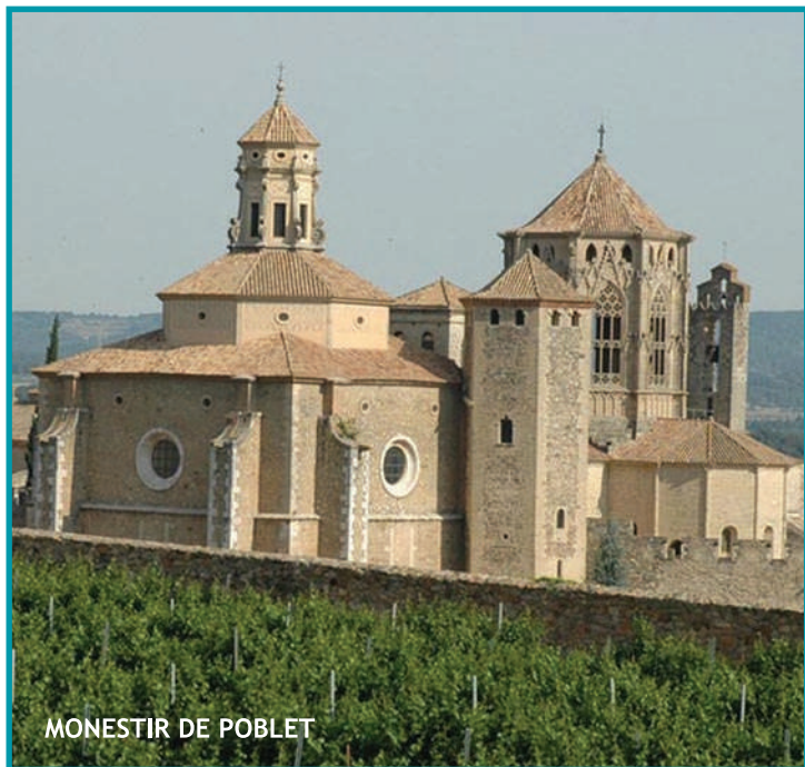
MONESTIR DE POBLET

Desplaçament amb autobús acompanyat per un de nosaltres, entrada guiada als llocs i dinar